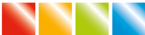
Rouge Feu Jaune Foncé Vert Citron Bleu Clair