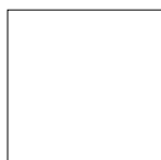
Blanc mat (standard)