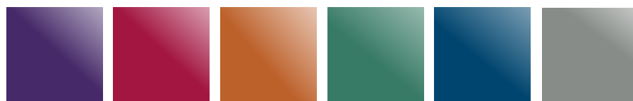
Violet Rouge Cerise Orange Flamme Vert Émeraude Bleu Foncé Anthracite