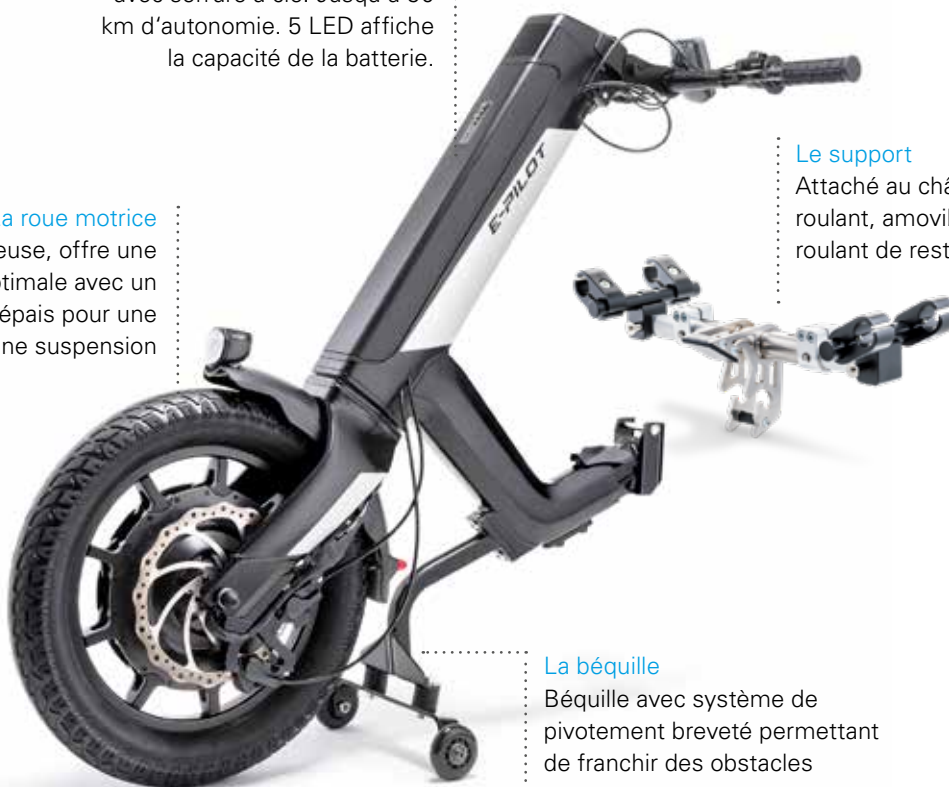
Cette image montre la version standard avec le e-Pilot blanc.

Béquille avec système de pivotement breveté permettant de franchir des obstacles